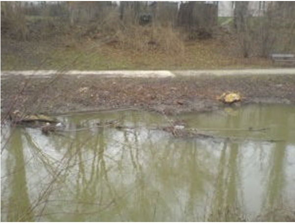
faellung in staubereich2