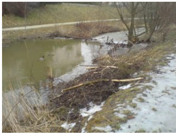
burg im staubereich