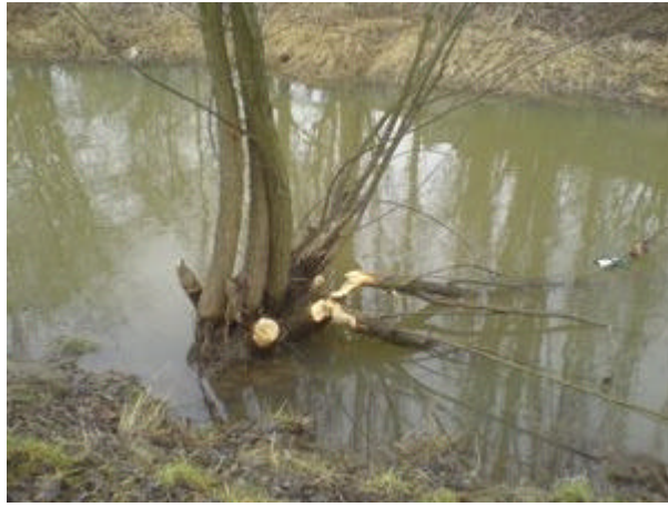
faellung in staubereich3