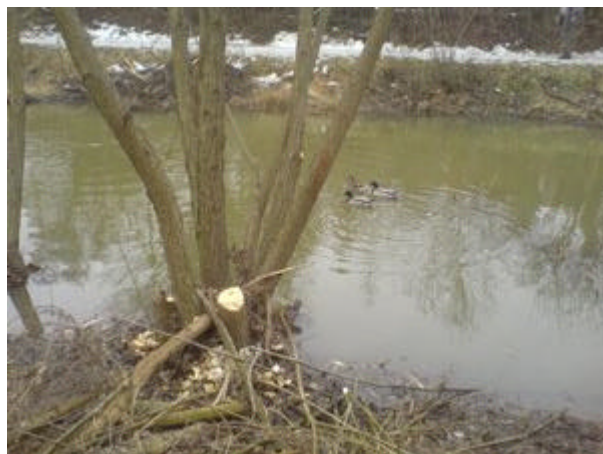
faellung in staubereich1