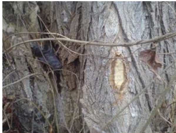
nagestelle im uferdamm2