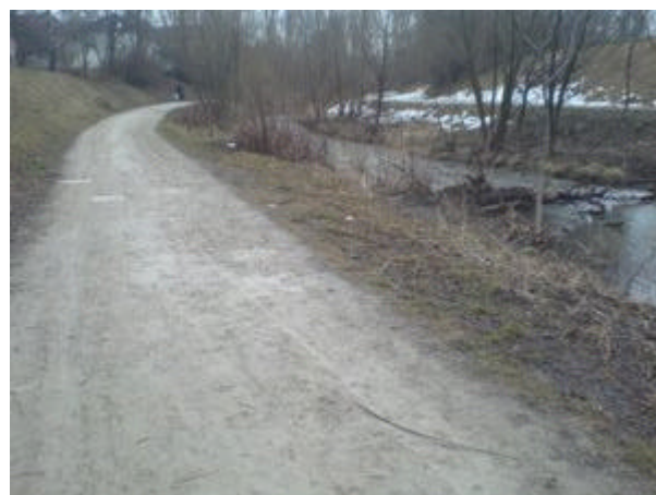
zeitweise ueberschwemmter weg