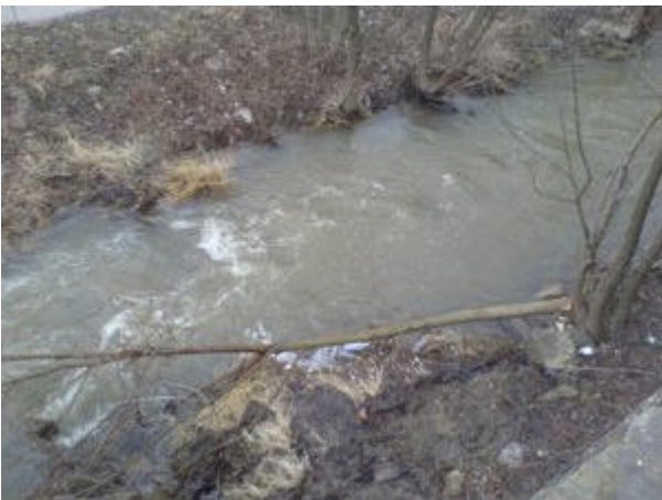
faellung unterhalb stau2