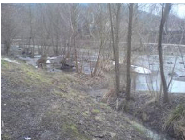
revitalisierter bereich ohne spuren