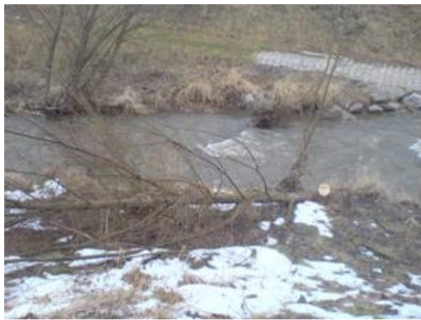
faellung unterhalb stau1