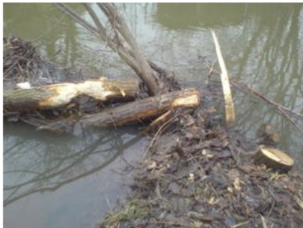
faellung in staubereich4