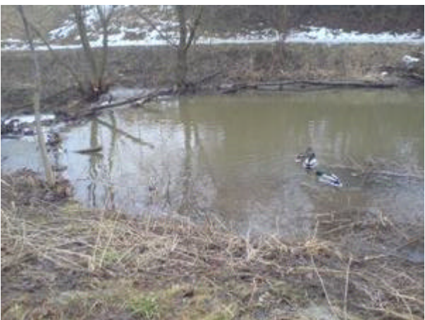
enten im staubereich