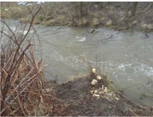
faellung unterhalb stau